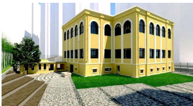
（前賈梅士學校活化為香港話劇團教育中心後的構想圖）

香港話劇團教育中心將於佐敦覺士道（前賈梅士學校）正式開幕，致力為油尖旺區營造開放、包容及共融的藝文生態。由油尖旺民政事務處贊助，香港話劇團主辦之「好融 Hub」油尖旺社區藝術計劃，現舉辦藝術品創作比賽，讓公眾多角度認識油尖旺區。誠邀油尖旺區內中、小學及幼稚園派同學參賽，費用全免，入選作品將於香港話劇團教育中心展出，優勝者將獲發書券以作鼓勵。