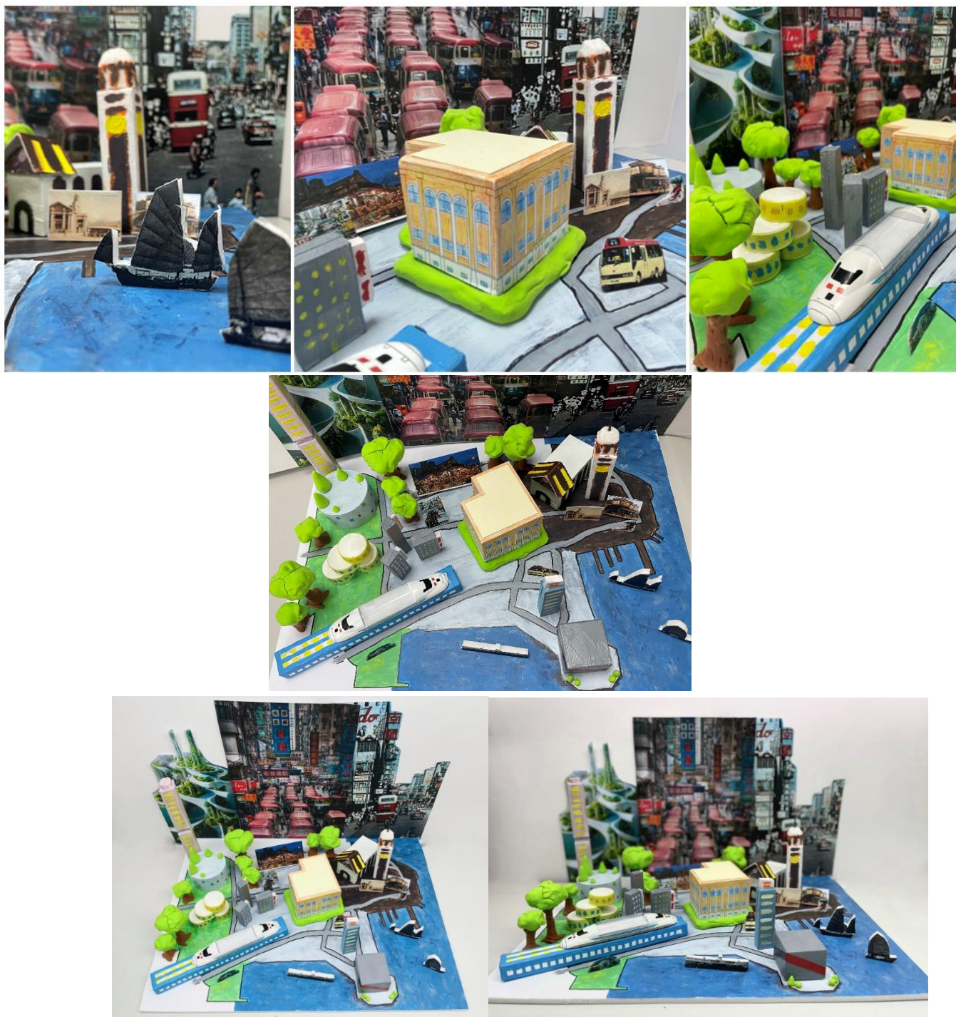
( 示範作品 ) 「 油尖旺的過去、現在與未來 」